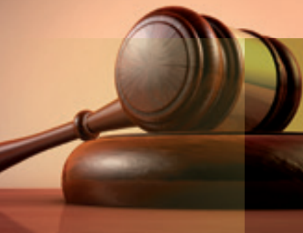
Univ.-Lektor RA DDr. HASCH HASCH & PARTNER

Haftung, Rechte, Pflichten & Tipps zur steuerlichen Bezugsoptimierung unter Berücksichtigung der Steuerreform 2016