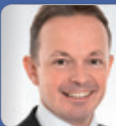
RA Dr. Konwitschka Experte f. Gesellschafts- & Versicherungsrecht Schönherr RAe