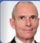
RA Dr. Frotz Experte f. Unternehmens- & Gesellschaftsrecht Frotz Rechtsanwälte