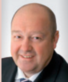
RA Dr. LUTZ, LL.M. Posch, Schausberger & Lutz RAe