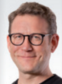
StB Ing. Mag. PATKA Steuer & Service GmbH