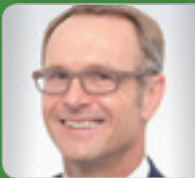
Mag. Lichtkoppler CTE (Certified Turnaround Expert) CONSPECTRA Unternehmens- beratung