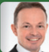
RA Dr. Konwitschka Experte f. Gesellschafts- & Versicherungsrecht Schönherr RAe