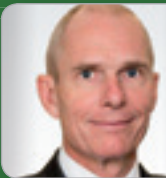
RA Dr. Frotz Experte f. Unternehmens- & Gesellschaftsrecht Frotz RAe OG