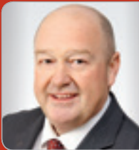
Univ.-Lektor RA DDr. Hasch Experte für Umgründungsrecht HASCH & PARTNER Anwalts-gesellschaft mbH