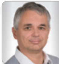
Mag. Dr. Egger Wirtschaftsprüfer und Steuerberater NÖWP