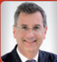
RA Dr. Bruckmüller Rechtsanwalt & Partner Bruckmüller Rechtsanwalts-gmbH